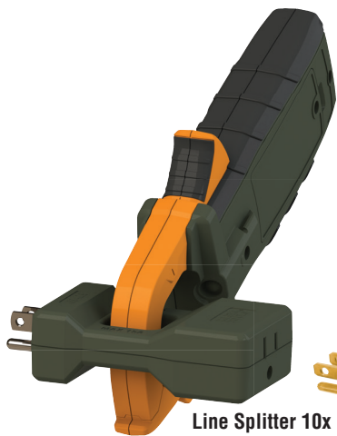
Line Splitter 10x Divisor de línea x10 Séparateur de lignes 10x