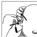
Insert into your ear and wait for it to expand