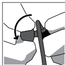
Roll foam between your fingers