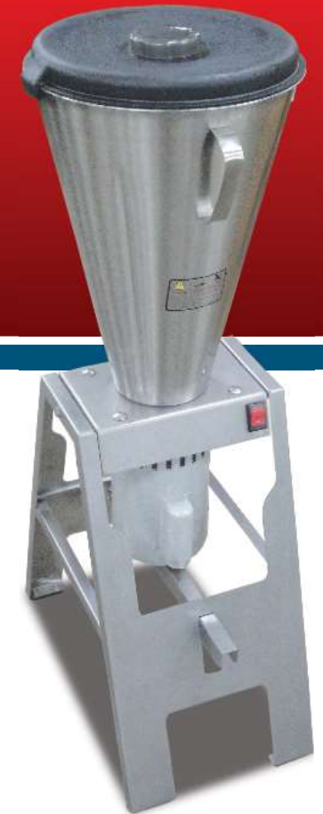
Industrial Blender / Licuadora Industrial