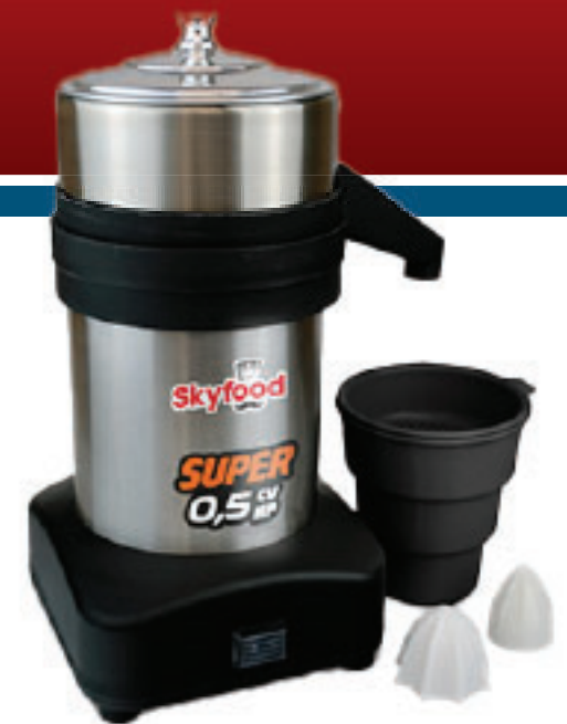
Juice Extractor / Exprimidor de Cítricos

- BESIDES THIS EQUIPMENT, A COMPLETE RANGE OF OTHER PRODUCTS ARE MANUFACTURED, CONSULT OUR DEALERS - DUE TO THE CONSTANT IMPROVEMENTS INTRODUCED TO OUR EQUIPMENTS, THE INFORMATION CONTAINED IN THE PRESENT INSTRUCTION MANUAL MAY BE MODIFIED WITHOUT PREVIOUS NOTICE.