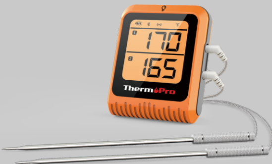
Sonde Double à Distance Bluetooth Meat Thermomètre