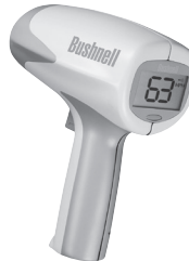
Model #: 101911 Lit. #: 98-0593/6015